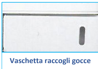
Vaschetta raccogli gocce