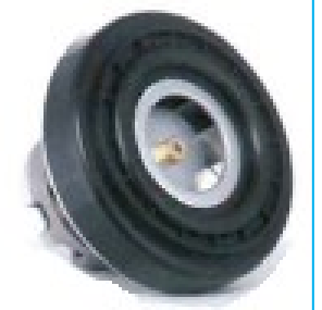
Motore ad alta velocità Jet System BRUSHLESS