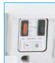
Interruttore on/off Resistenza e velocità